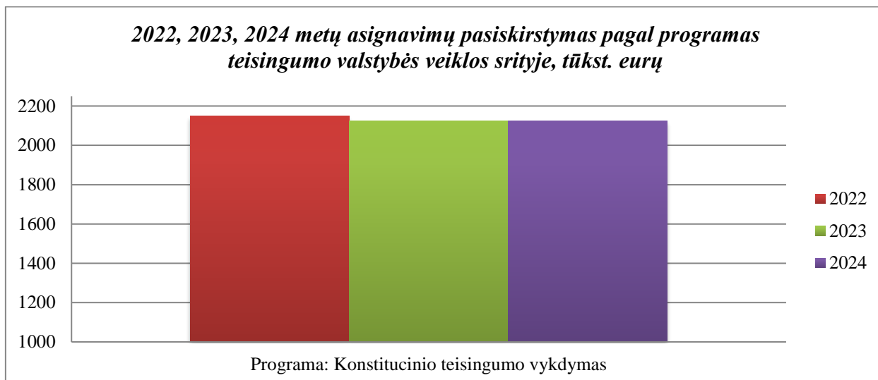
1 grafikas. 2022–2024 metų asignavimų pasiskirstymas pagal programas