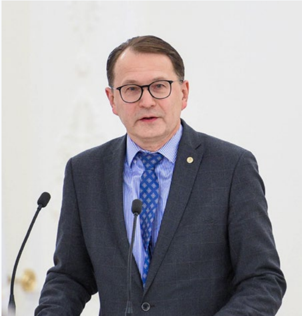
Prof. dr. Dainius Žalimas. Konstitucijos egzaminas 2019 m. spalio 28 d.

Galiu drąsiai sakyti, kad Konstitucinis Teismas 2014–2021 m. pasikeitė neatpažįstamai. Šie metai atnešė naujų patirčių ir netikėtų iššūkių, buvo kupini permainų, įtampos ir susitelkimo. Konstituciniam Teismui teko patirti ir bandymų daryti jam įtaką – didžiuojuosi, kad pavyko tam atsispirti. Toliau plėtojome tokią jurisprudenciją, kuri pelnytai gali būti laikoma oficialiosios konstitucinės doktrinos plėtros pavyzdžiu daugeliui valstybių ir daugeliu klausimų.